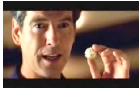
Besitz der Goldkugel wird zur betörenden Macht