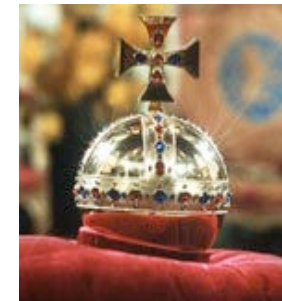
Beispiel: FERRERO ROCHER und der Mythos der Goldkugel