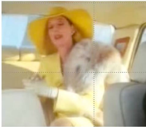
Banale Schokogier wird in edle Kultiviertheit verwandelt